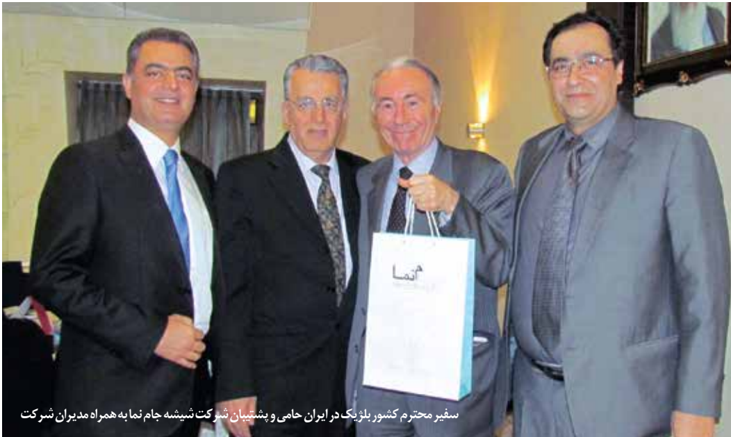
سفیر محترم کشور بلژیک در ایران حامی و پشتیبان شرکت شیشه جام نما به همراه مدیران شرکت

آنچه پیش رو دارید سومین شماره از خبرنامه جام نما می باشد. شرکت شیشه جام نما نماینده و واردکننده انحصاری شیشه‌ها و آئینه‌های رنگی AGC بلژیک است. خبرنامه‌ای که در دست دارید با هدف اطلاع رسانی درباره محصولات این شرکت و ویژگی‌های آن‌ها، نحوه اجرا و نصب و آگاهی نسبی از کیفیت این محصولات در مقایسه با نمونه‌های مشابه و گاه تقلبی، منتشر شده است. جستجوی راه‌های بهتر و کارآمد برای برقراری ارتباط مؤثر با مشتریان محترم بی تردید از اصلی‌ترین اهداف انتشار خبرنامه جام نما است. مطالبی در مورد محصولات جدید شرکت جام نما، اخباری در مورد تازه‌ترین اقدامات این شرکت برای خدمت رسانی بهتر و جزئیاتی در مورد گروه اجرایی جام نما از جمله مطالبی است که در این شماره خواهید خواند.